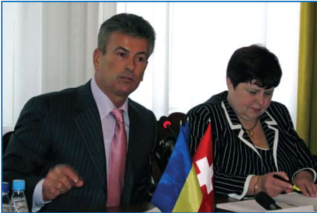
Голова Верховного Суду України Онопенко Василь Васильович, професор Луць Людмила Андріївна

Останні 2-3 роки різними суб'єктами законодавчої ініціативи пропонуються до розгляду Верховній Раді України багато законопроектів щодо реформування національного правосуддя. Існує затверджена Президентом України Концепція вдосконалення судівництва для утвердження справедливого суду в Україні відповідно до європейських стандартів. В рамках діяльності Національної комісії зі зміцнення демократії та утвердження верховенства права здійснюється опрацювання пропозицій щодо змін до розділу VIII “Правосуддя” Конституції України. Практично на сьогодні йде мова про формування нової судової політики держави.