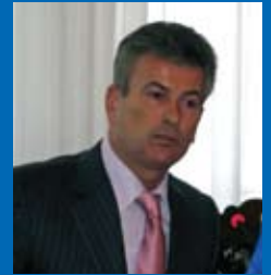
ОНОПЕНКО Василь Васильович, Голова Верховного Суду України

У зв'язку з цим ми зміцнили наше правове управління, робимо висновки щодо тих законопроектів, які надходять з Верховної Ради від комітетів.