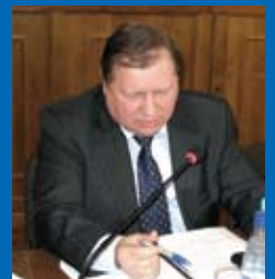
ГНАТЕНКО Андрій Васильович , голова Судової палати в цивільних справах Верховного Суду України

У мене таке до вас запитання. Сьогодні нашому громадянському суспільству чітко ставиться