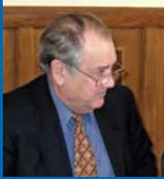
БОЙКО Віталій Федорович, Голова Верховного Суду України у відставці

судову політику в тому вигляді, як ми його розуміємо? Після вашої прекрасної інформації ці питання у мене зняті.