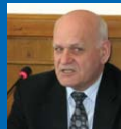
НЕЧИПОРЕНКО Юрій Аркадійович, голова Апеляційного суду Київської області

НЕЧИПОРЕНКО Ю.А. Я хотів би доповнити, що якби штрафні санкції були більш високі, суди застосовували їх частіше, ніж позбавлення права керування транспортним засобом. Тому що позбавлення прав, з моєї точки зору, це вже є крайній захід. Але порядок на дорогах треба наводити. І 40 тисяч громадян, яких позбавили прав – така цифра „гуляє” в пресі, то, мабуть, половина, а може і більше, незаконно позбавлені прав. Але ви бачите, як нала-