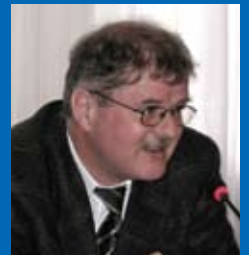
Уелі МЮЛЛЕР, Директор Бюро співробітництва Швейцарії в Україні